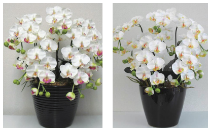
..... 黒鉢 .....