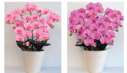
..... 白鉢 .....