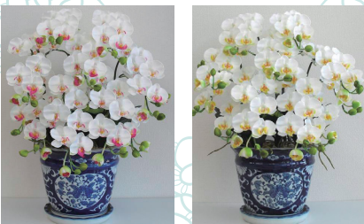
..... 白・青(デザイン鉢) .....